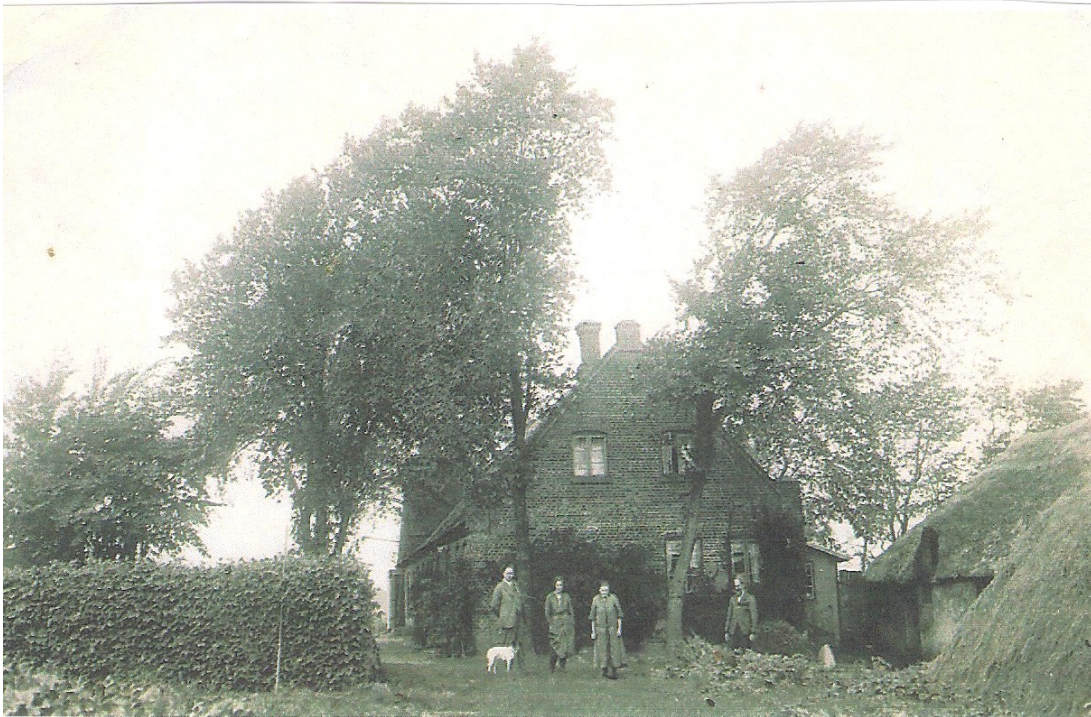
Fabrikken og hjemmet i Dagsvad 1940.